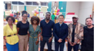
Rencontre à l'AfroMozaiç au CCVA le 23 mai 2026