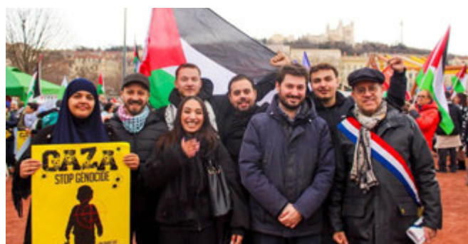
Mobilisation à Lyon face au génocide à Gaza le 31 janvier 2026

A l'heure où nous écrivons ces mots, le gouvernement et l'Union européenne n'ont toujours pas agi et Ben-Gvir vient de déclarer "Tout le Liban doit brûler". Il est tant que la voix indépendante et pacifique de la France soit rétablie sur la scène internationale en 2027.