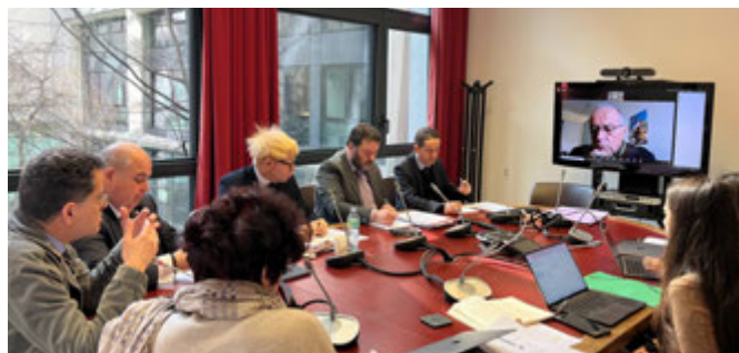
Audition des maires ruraux de France le 5 mars 2026

En l'absence de portage politique, après un transfert de responsabilités de l'État vers les collectivités par une simple ordonnance prise sans débat en décembre 2022, ce sont en définitive des associations comme Solidarités Internationales, la Coalition Eau, la Fédération nationale des collectivités concédantes et régies (FNCCR) et l'Association scientifique et technique pour l'eau et l'environnement (ASTEE), qui ont élaboré les deux seuls