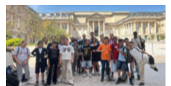
Visite de l'Assemblée Nationale avec les CM2 de l'école Antonin Perrin le 26 juin