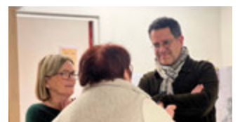
Participation aux vœux de l'Union Locale Croix Rouge Villeurbanne le 30 janvier 2026