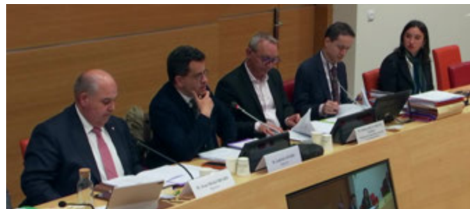
Présentation du rapport à la délégation aux collectivités territoriales le 15 avril 2026