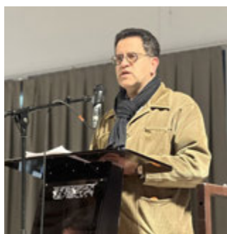
Discours au Meeting contre la guerre à Vénissieux, le 31 avril 2026

A L'HEURE OÙ NOUS ÉCRIVONS CES MOTS, LE MINISTÈRE DE LA SANTÉ DE GAZA ESTIME QU'AU MOINS 73 000 PERSONNES ONT PERDU LA VIE DANS LA BANDE DE GAZA DEPUIS L'INVASION PAR L'ARMÉE GÉNOCIDIAIRE DU GOUVERNEMENT NETANYAHU, SOIT UNE PERSONNE SUR TRENTE, CHIFFRES VALIDÉS PAR LES NATIONS UNIES ET L'OMS.