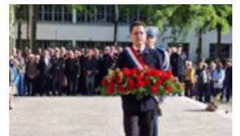
Commémoration du 8 mai sur la place du Dr Lazare Goujon le 8 mai 2026