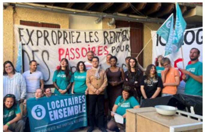
Rencontre avec des locataires et le mouvement Locataires Ensemble le 5 juin 2026

Le droit au logement ne peut pas rester un vœu pieux. Il doit devenir une réalité pour chaque Villeurbannaise, chaque Villeurbannais, pour chaque Française, chaque Français.