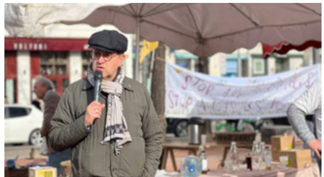
Discours lors de la mobilisation à Lyon face à la loi Duplomb le 7 février 2026

Nous, nous avons choisi le vivant et d'en finir avec les épidémies de cancers.