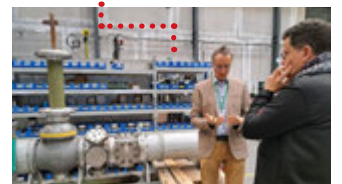
Visite du site de l'institut Supergrid le 3 avril 2026